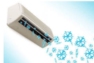
AstVO EN15251 EN 16798 CEN/TR 16798-4

Einhaltung von: (+ Temperatur) (+ Zugluft) + Feuchtigkeit